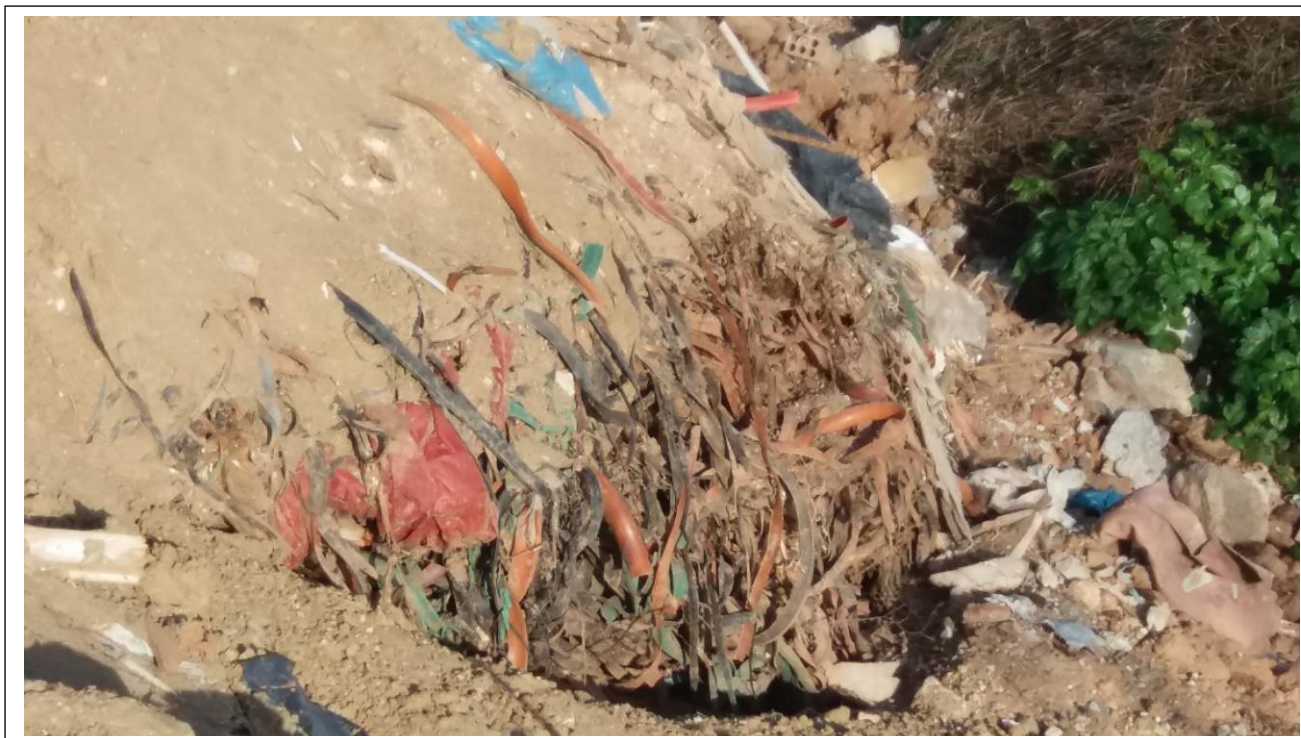
Απορρίμματα και μπάζα μετά την διάστρωση στο χώρο του τριβείου Μουζάκη