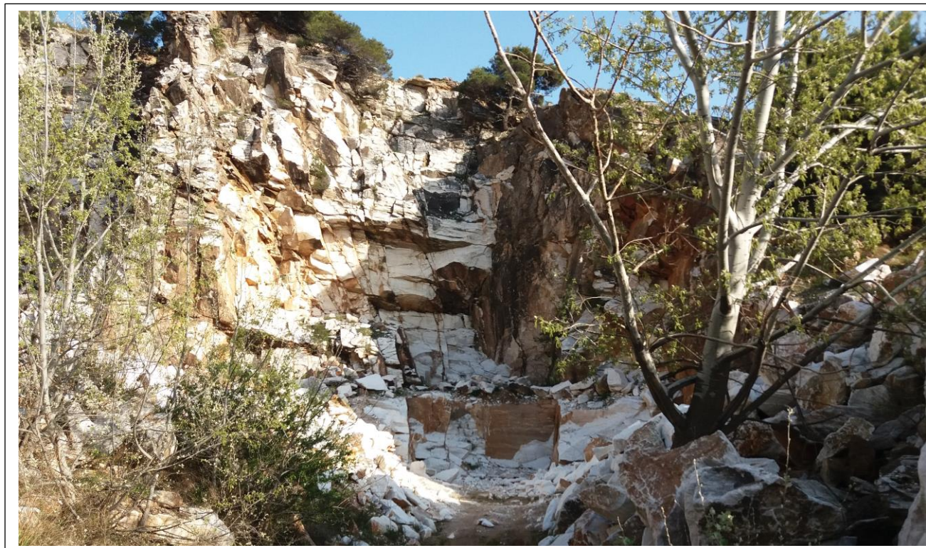
Πρόσφατη παράνομη εξόρυξη στο νότιο άκρο του λατομείου.