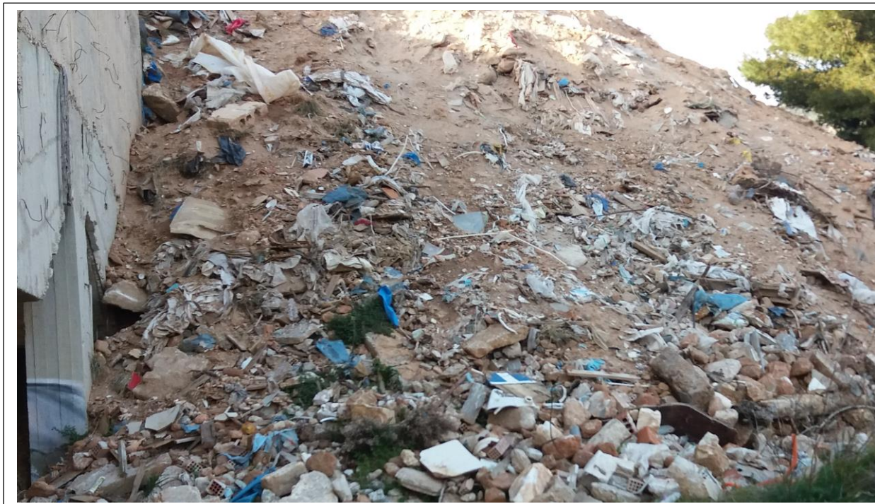
Απορρίμματα και μπάζα μετά την διάστρωση στο χώρο του τριβείου Μουζάκη

ΥΓ1. Ακολουθούν φωτογραφίες από την περιοχή, μετά το εγχείρημα.