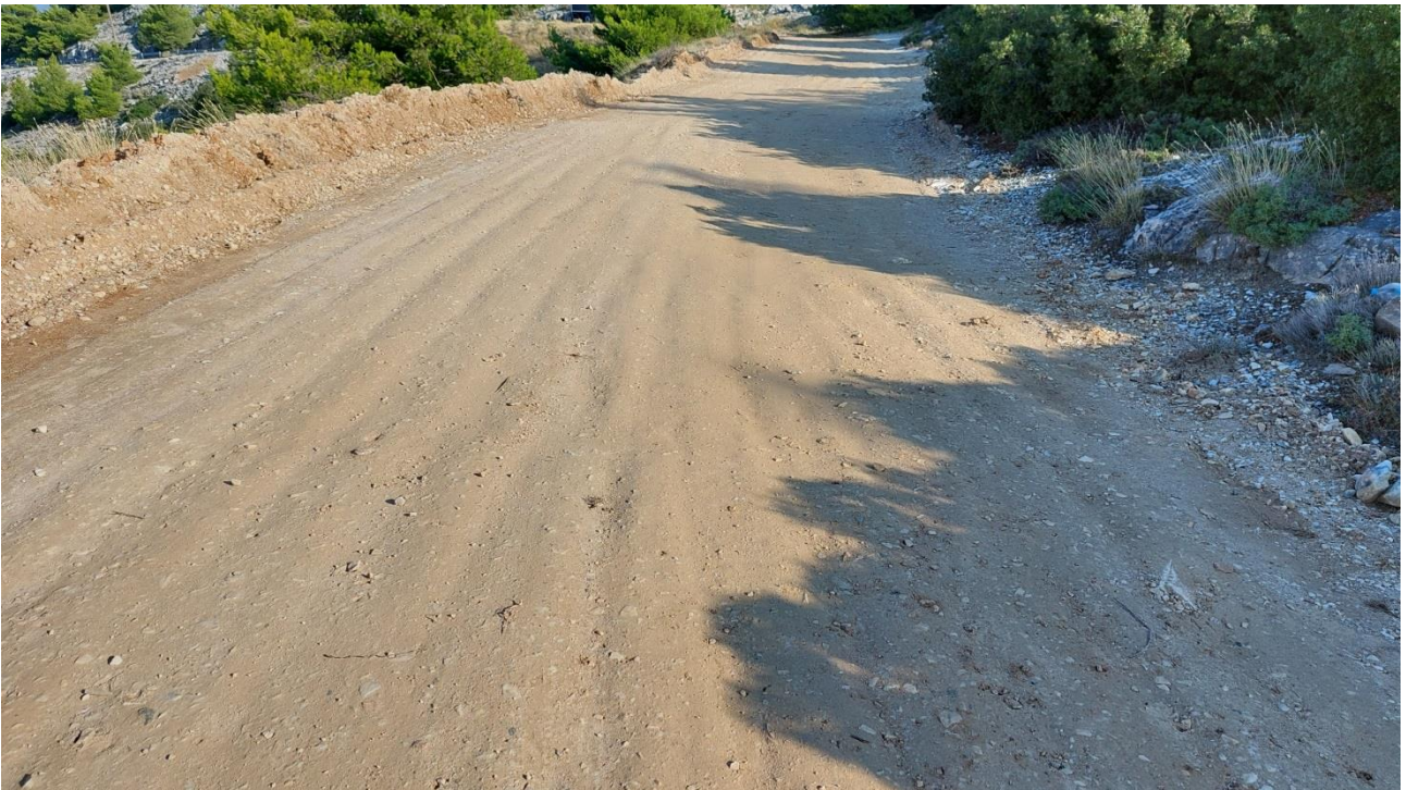
Χωματουργικές εργασίες διάστρωσης αμμοχάλικου και συμπίεσης στην προσαγωγό δασική οδό