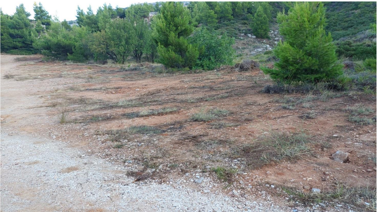
Αποψίλωση για δημιουργία παρόδιων θέσεων στάθμευσης