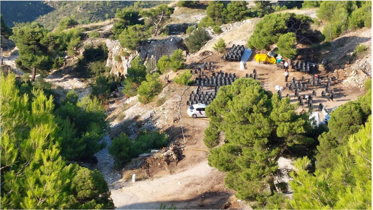
Ο χώρος της συναυλίας από ψηλά