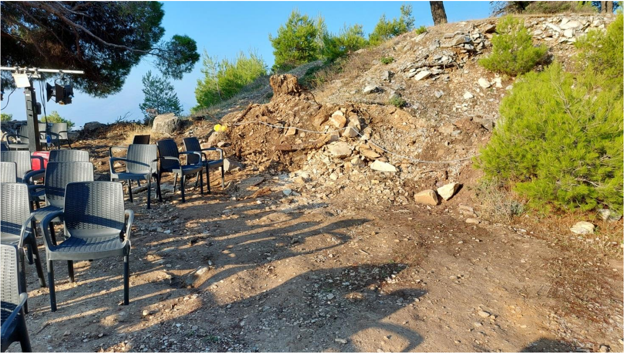
Καταστροφή κώνου παραπροϊόντων εξόρυξης του αρχαίου λατομείου