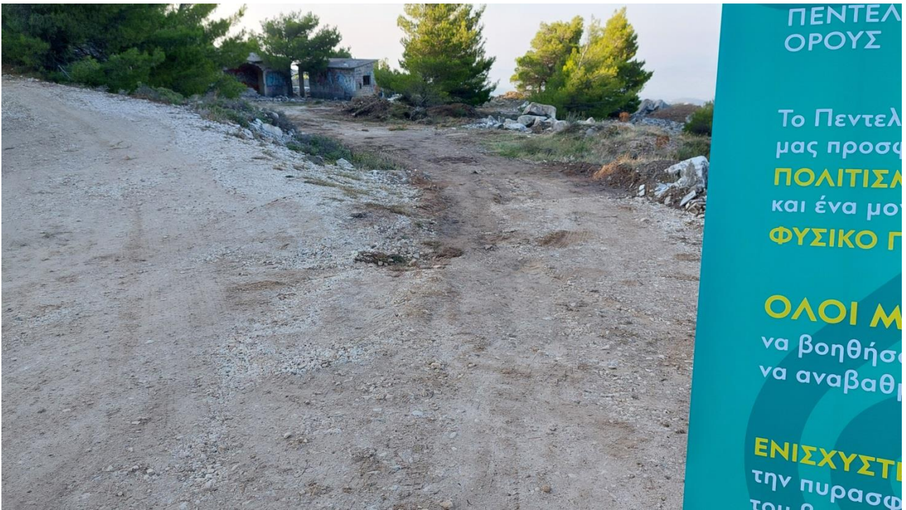
Διάνοιξη για δημιουργία θέσεων στάθμευσης εγγύς του χώρου