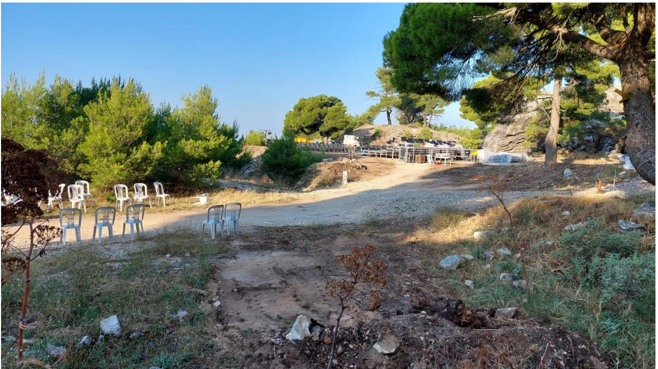
Ο χώρος της συναυλίας, διακρίνεται η αρχή της οδού λιθαγωγίας στα αριστερά.