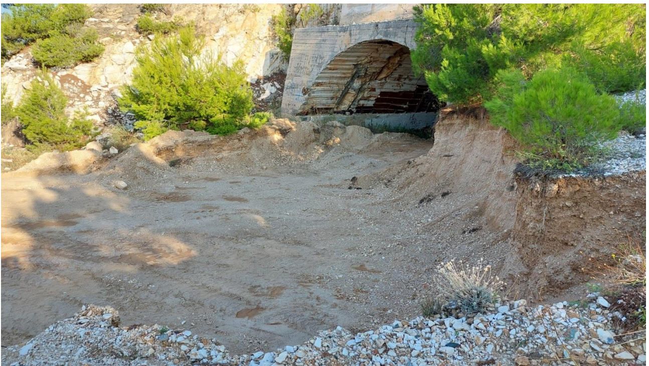
Δανειοθάλαμος απόληψης αμμοχάλικου από θέση ανατολικά της στοάς