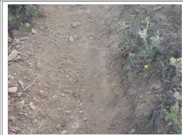
Καταστρεπτικές για το φυσικό τοπίο διελεύσεις δίτροχων (καταστροφή φυτοκάλυψης, κονιορτοποίηση, παράσυρση)