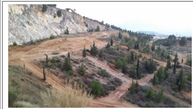
Πίστα στο πρώην λατομείο Μαλτέζου - καταστροφή έργων ανάπλασης (φύτευσης, δικτύου άρδευσης)