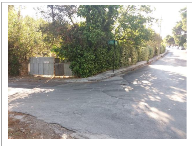
Η περίφραξη της κοίτης στην Παπανδρέου