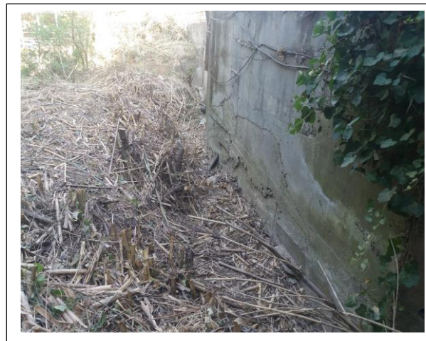
Η μάνδρα εντός της κοίτης