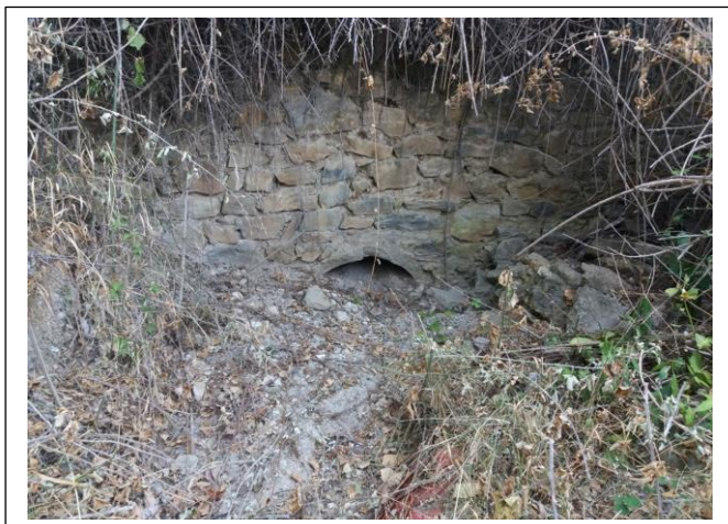
Ο οχετός κάτω από την οδό Δελφών