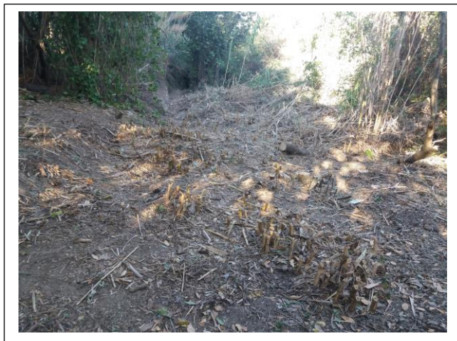
Τα ασαφή όρια της κοίτης