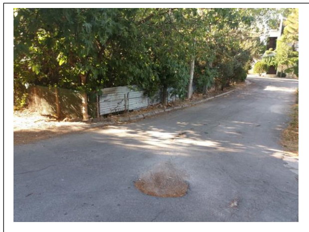
Η περίφραξη της κοίτης στην Βαλτετσίου