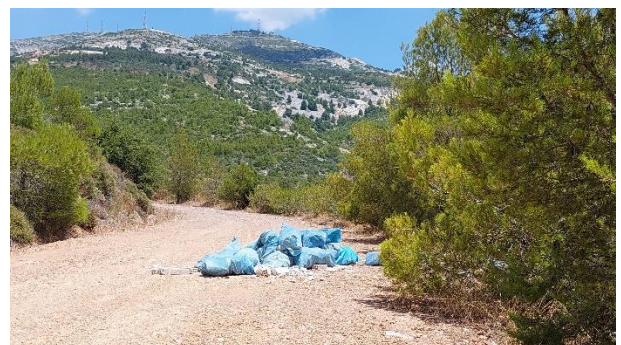
Μπάζα στο Πεντελικό στις 30/8/2023 (Κοκκιναράς) και στις 8/7/2023 (Νέα Πεντέλη)

Για όλα αυτά η Δήμαρχος σιωπά επιδεικτικά, θεωρώντας ενδεχομένως ότι τα εν λόγω θέματα δεν την αφορούν.