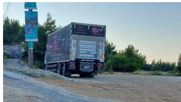
Ο χώρος της συναυλίας στο αρχαίο λατομείο και μέσο μεταφοράς του εξοπλισμού

Καλούμε τους ανύποπτους φιλότεχνους πολίτες, αναλογιζόμενοι τους κινδύνους που εγκυμονεί για το περιβάλλον η καθιέρωση μαζικών εκδηλώσεων στο βουνό, να απαρνηθούν την ενδεχόμενη πρόσθετη απόλαυση που προσπορίζει η παρακολούθηση μιας συναυλίας στο βουνό σε σύγκριση με την διεξαγωγή της σε μια κατάλληλη αίθουσα και να μη συμμετέχουν στην εκδήλωση στέλνοντας μήνυμα αναστοχασμού για τις τεράστιες καταστροφές των φετινών πυρκαγιών και την ανάγκη επιτάχυνσης της πολυπόθητης αποκατάστασης οικολογικής ισορροπίας του Πεντελικού.