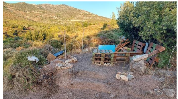
Ο χώρος του παρατηρητηρίου / κερκίδων θεατών motocross στις 28/1/2023 και στις 30/8/2023