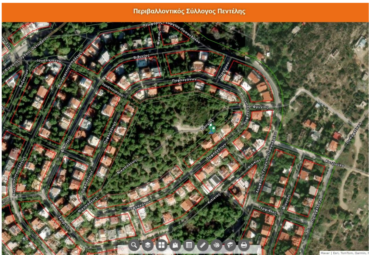
Απόσπασμα του εγκεκριμένου σχεδίου

Εσωτερικά των οικοπέδων και προς την πλευρά του λόφου προβλέπεται από το εγκεκριμένο σχέδιο της Νέας Πεντέλης οδός πλάτους 6,0 μ. με πράσινη γραμμή προς την πλευρά του λόφου, οδός η οποία συνδέεται με την Παφλαγόνων νοτίως με επέκταση της οδού Νικοπόλεως και βορειοανατολικά με επέκταση της οδού Φρυγίας.